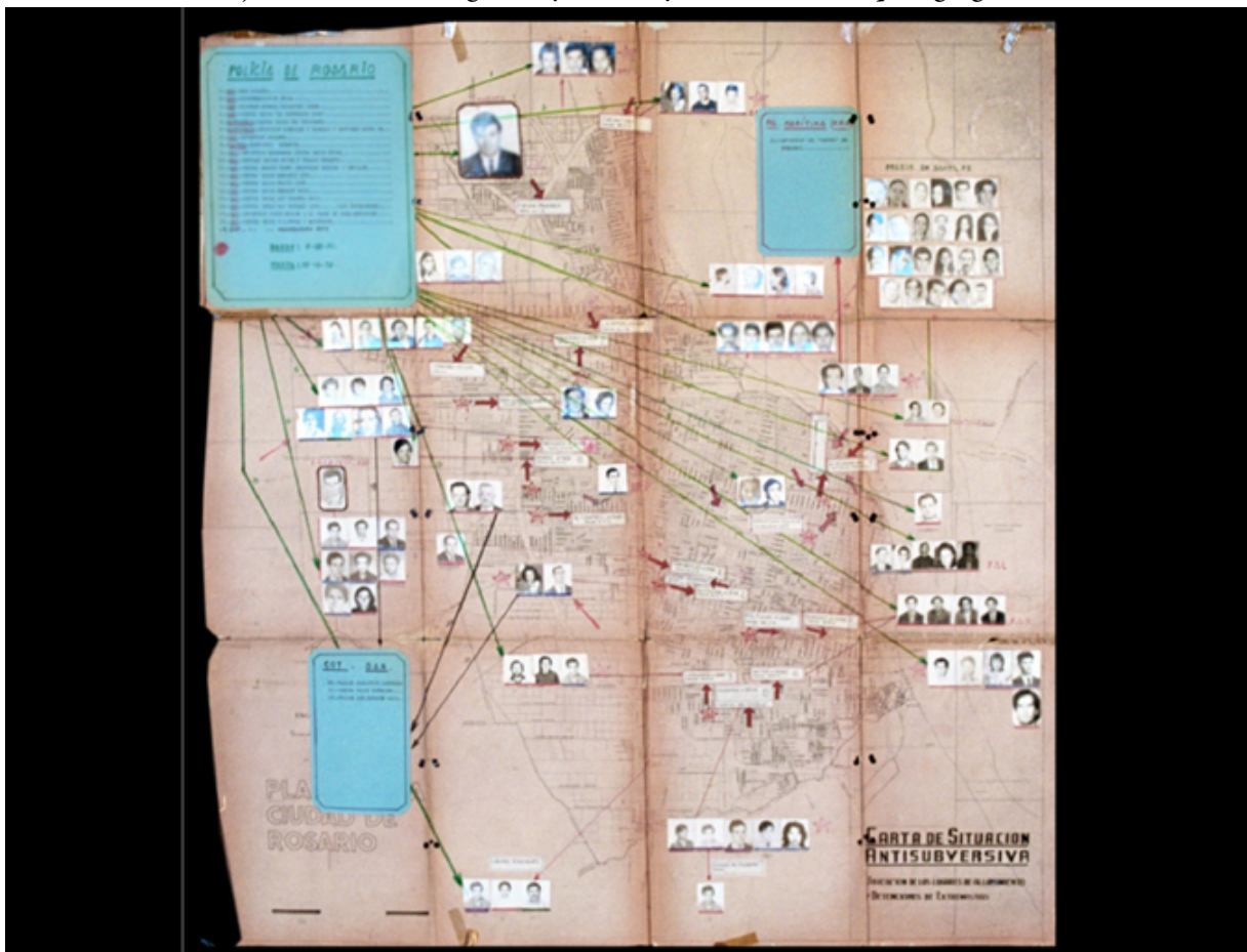
CPM -Fondo DIPPBA- Mesa "DS" (delincuente subversivo) Legajo 641.

Mapa de Rosario elaborado por el Jefe de policía de la ciudad, donde se señalan los domicilios de militantes junto con sus fotografías y se incluyen anotaciones que agregan información