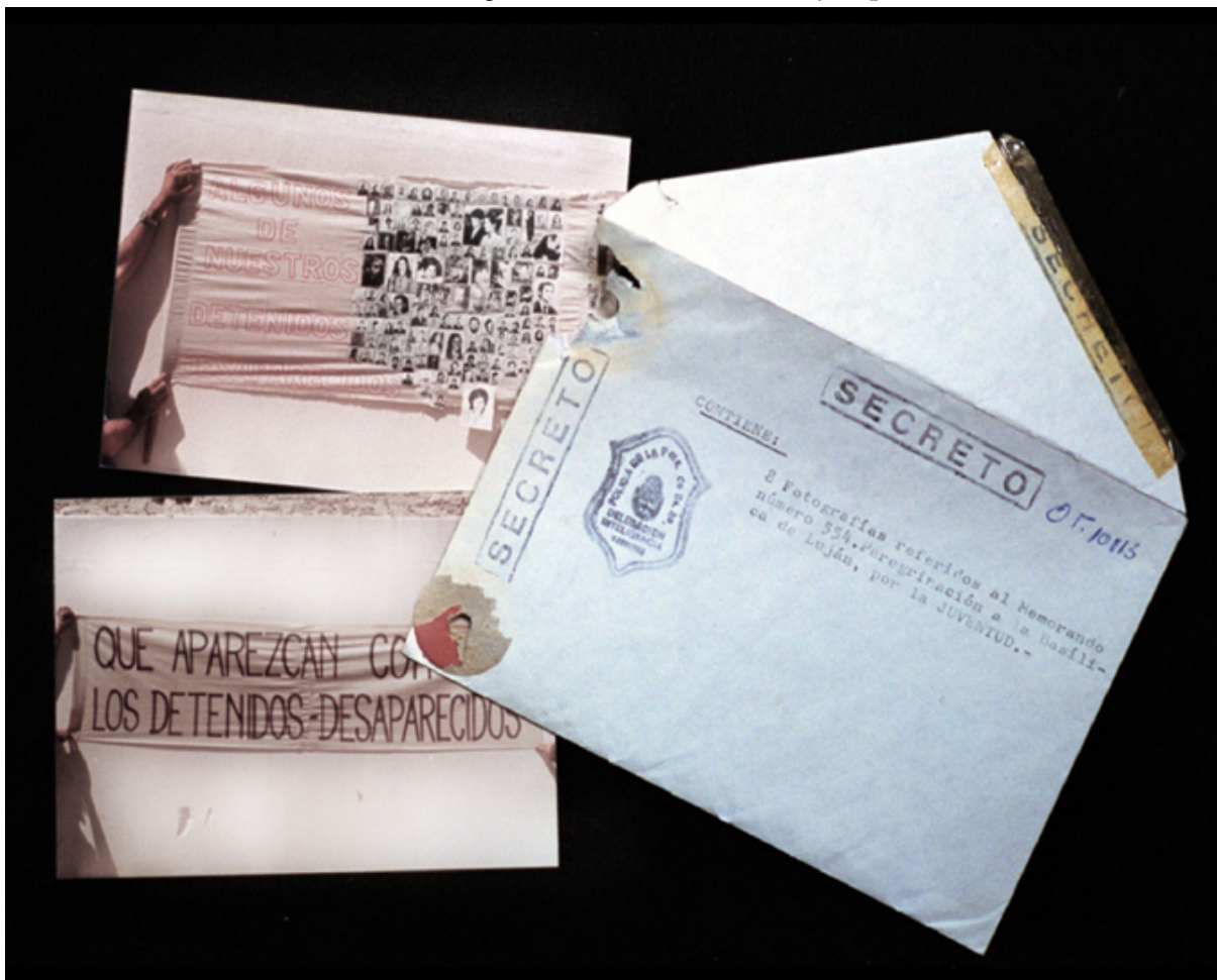
CPM -Fondo DIPPBA – Div. C. A y F, Mesa De, Factor Religioso, Legajo Número 570.

Sobre con el sello de 'SECRETO' y la inscripción: "Contiene 8 fotografías referidas al Memorando número 554. Peregrinación a la Basílica de Luján, por la JUVENTUD"