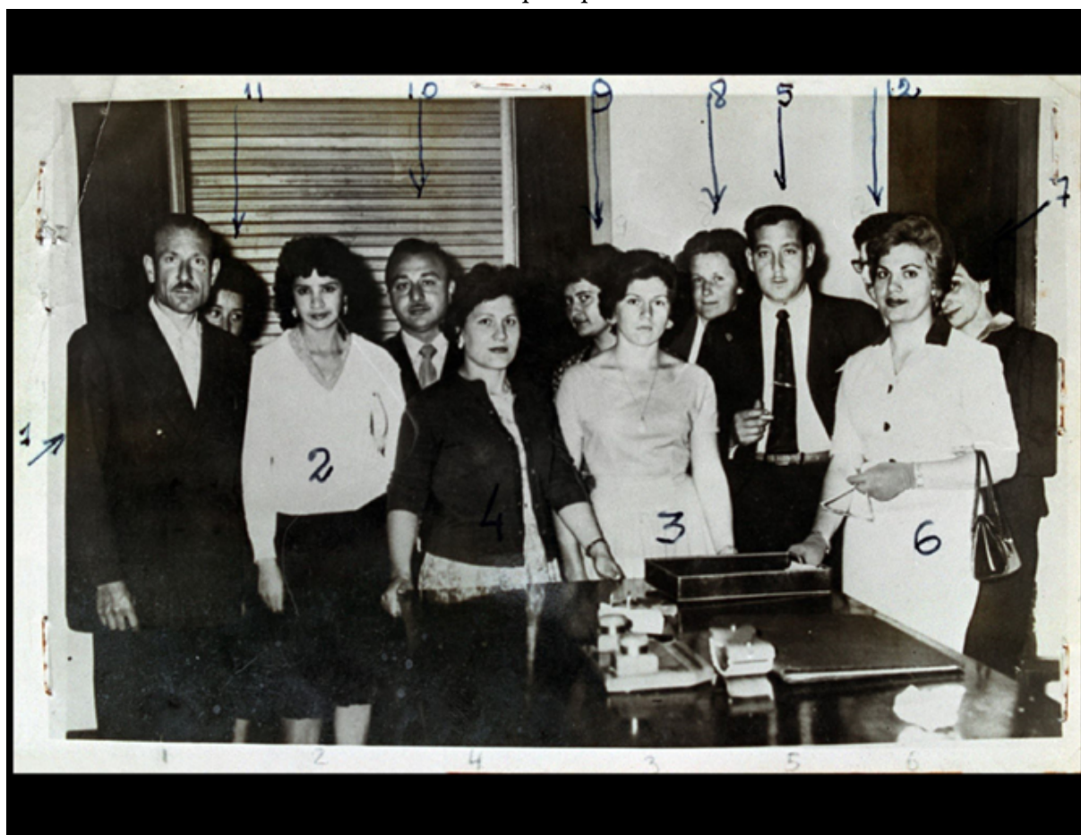
CPM -Fondo DIPPBA – División Central Archivo y fichero (Div. C. A y F) Mesa B, Factor Gremial, Berisso, Carpeta 16, Legajo 24 (1960).

Trabajadores de la Hilandería “The Patting Knitting” de Berisso en la redacción del diario El Día, donde se acercan a denunciar el atropello policial sufrido durante una manifestación.