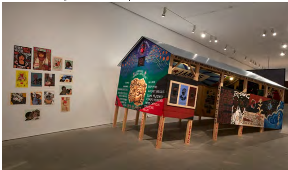
IMAGEN 2 Exposición Giro Gráfico: como el muro en la hiedra

campo del arte que tienen en común tanto la precariedad de los componentes y de los medios, como su potencial gráfico y de distribución. La exposición entiende la noción de gráfica en un sentido expandido y la idea de giro como revuelta, desafío al poder e inversión de lo dado. Como en el muro la hiedra hace referencia a un verso de la canción Volver a los diecisiete de la cantautora chilena Violeta Parra.