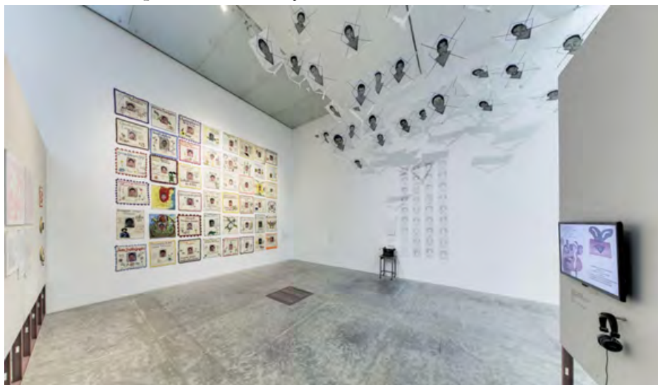
IMAGEN 5 Exposición Giro Gráfico: como el muro en la hiedra