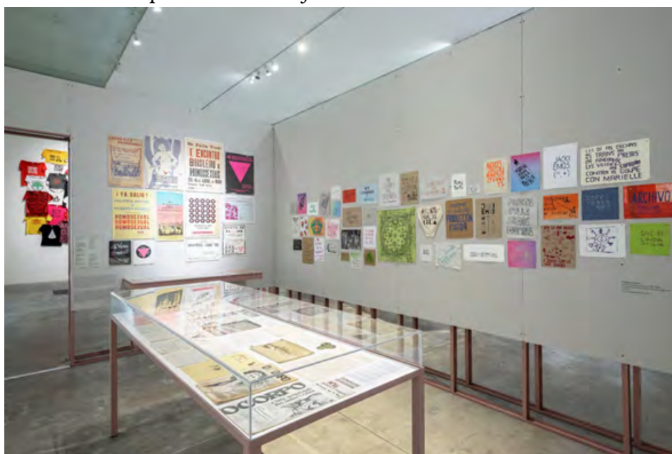
IMAGEN 6 Exposición Giro Gráfico: como el muro en la hiedra