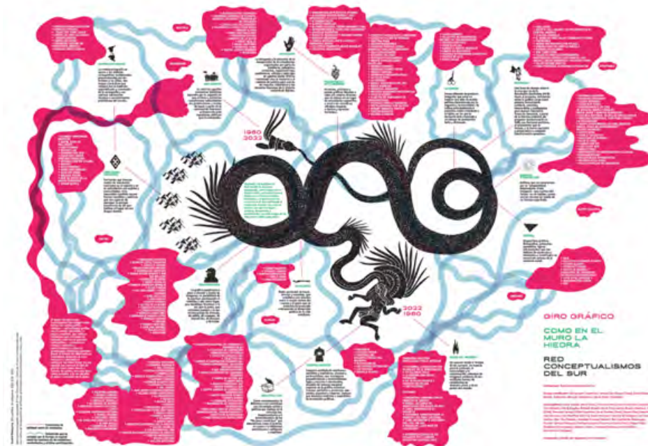
IMAGEN 7 Exposición Giro Gráfico: como el muro en la hiedra